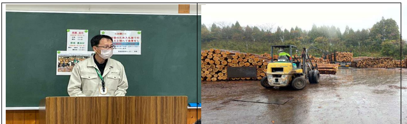
① 宮崎県森林組合連合会 東郷林産物流通センター 現地見学会の様子