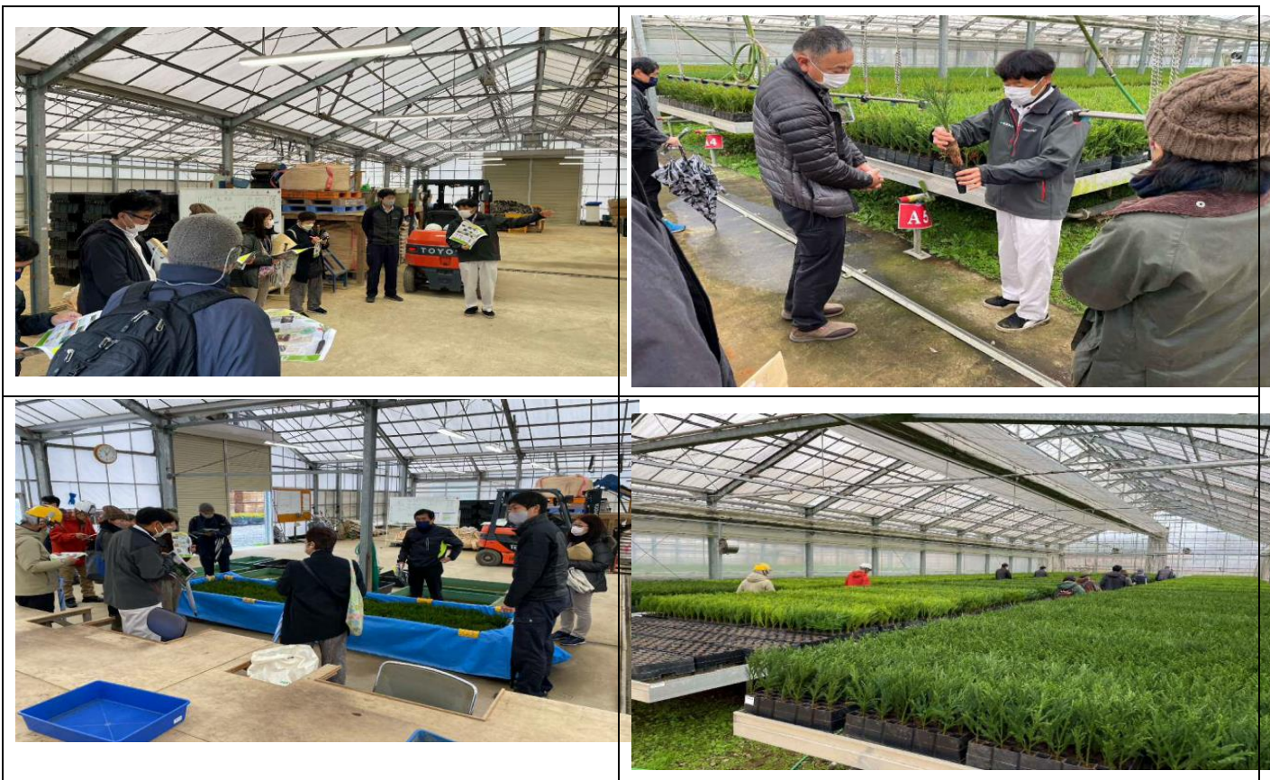
③住友林業（株） 日向山林事業所 東郷樹木育苗センター 現地見学会の様子