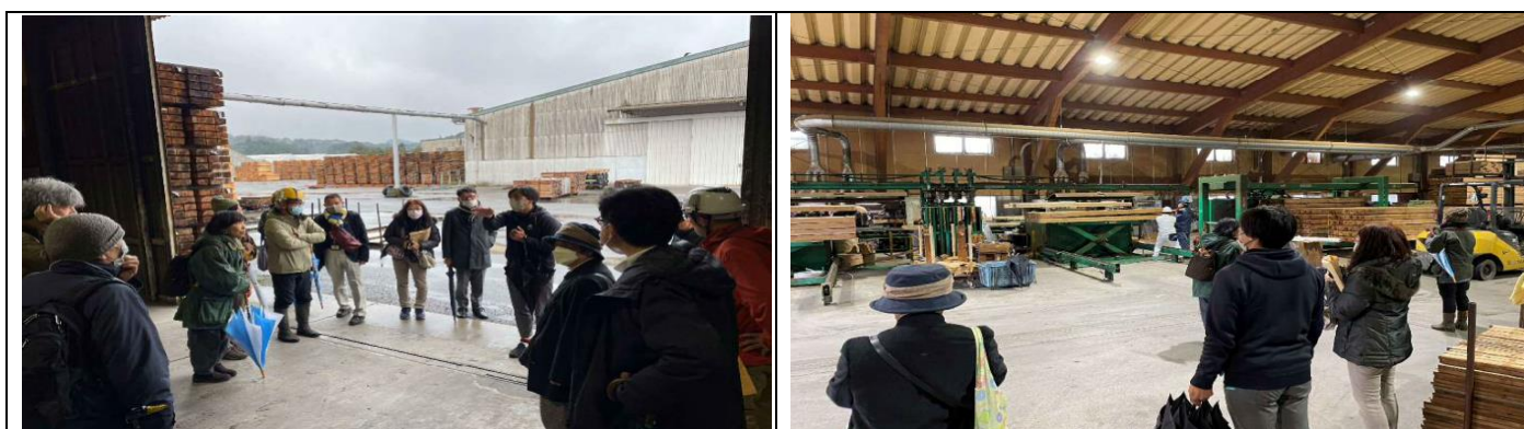
② 耳川広域森林組合 本所乾燥センター 現地見学会の様子